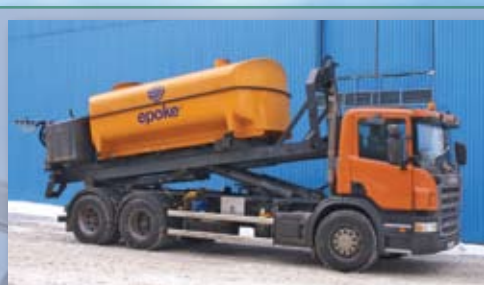
Распределитель жидких реагентов