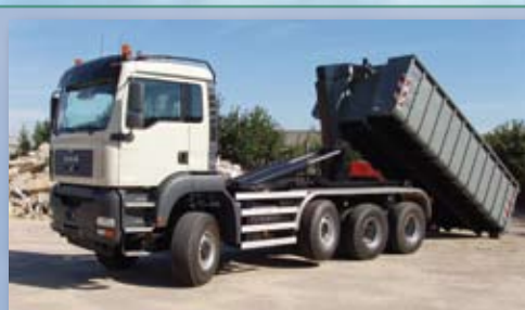
Контейнер для отходов: ТБО, лом и прочие

Система крюкового захвата - один автомобиль, транспортирует сменные кузова различного, функционального назначения: