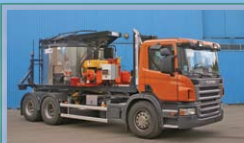
Термос-бункер для литого асфальта (кохер)